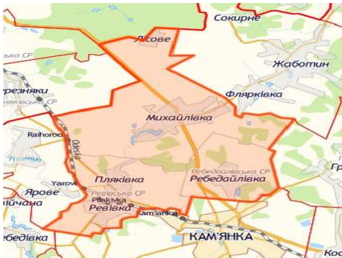
Рисунок 1. Карта Михайлівської ОТГ

Територія Михайлівської громади є нерозривною, її межі визначаються по зовнішніх межах юрисдикції рад територіальних громад, що об'єдналися сіл Михайлівка, Ревівка, Пляківка, Ребедайлівка та селище Лісове.